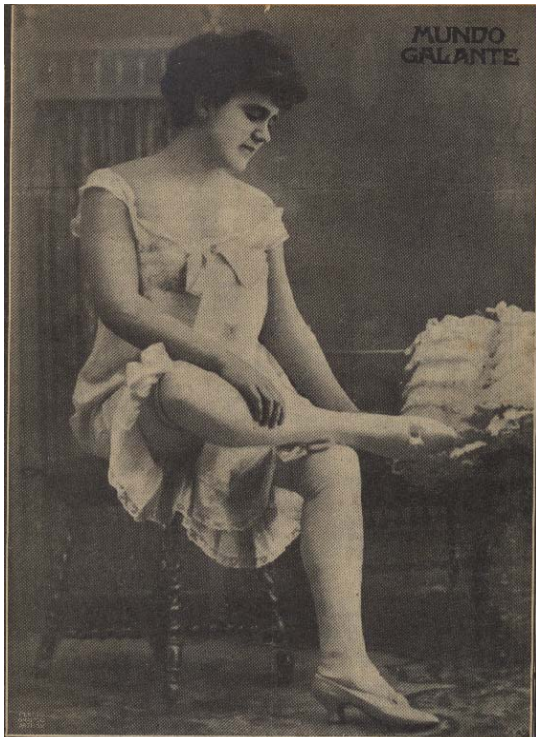
ANTONIA CACHAVERA - Notable artista del Teatro Nuevo. - (Cliché T. G.). N.º 86 REVISTA POPULAR DE ARTE Y LETRAS 10 cénts. ESTE PERIODICO ES GRATIS. - (Véase la página 18).